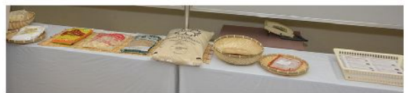
地場産物開発商品の展示