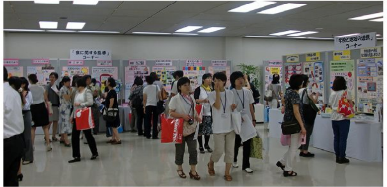
奈良県学校給食栄養研究会関係の展示