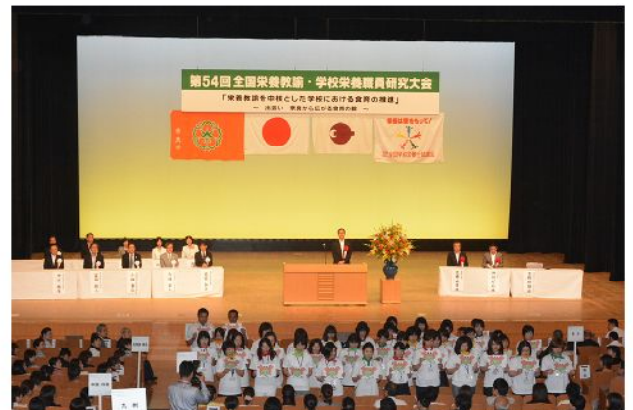
次期開催地あいさつ