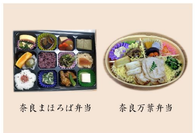
奈良まほろば弁当