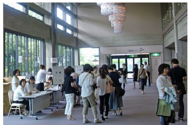
受付（国際ホールロビー）