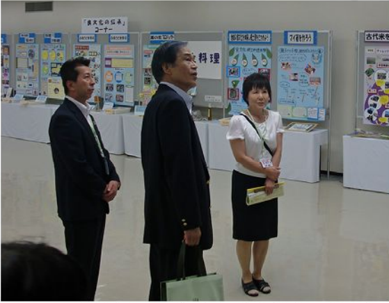
（本会事務局長・県教育長・栄養研究会会長）