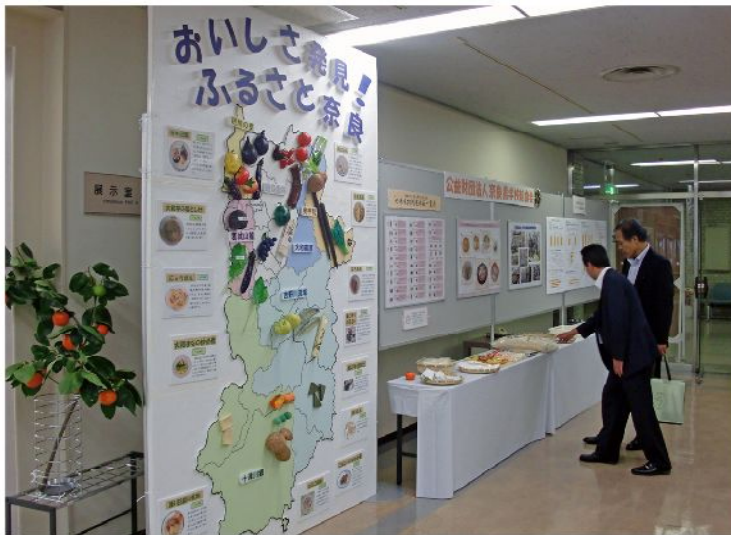
本会の展示・大地図（県教育長視察）