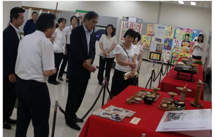
宮廷料理と藤原京の古代の食卓