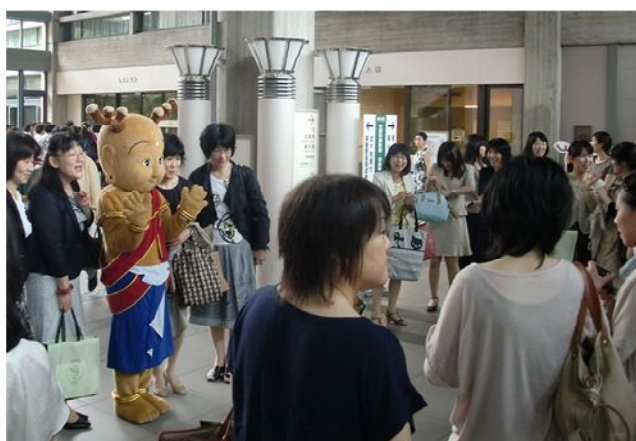
せんとくん（エントランスホール）