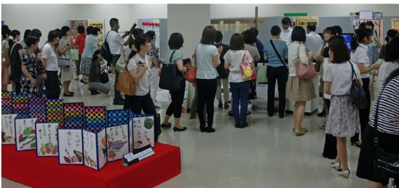
児童・生徒の作品