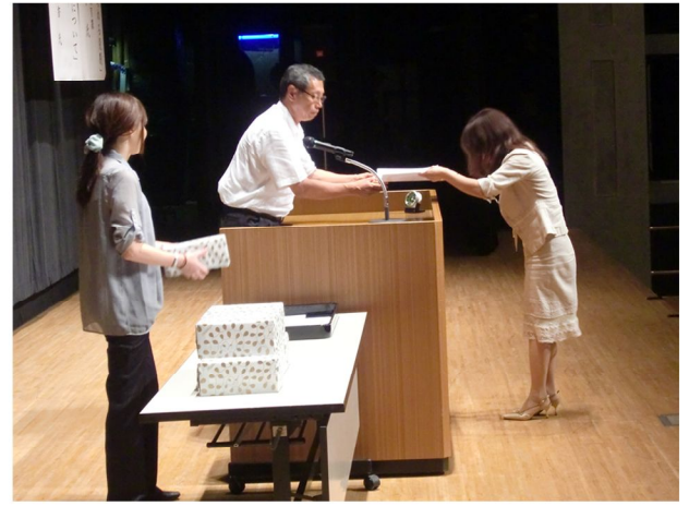
栄養教諭・学校栄養職員功労者表彰