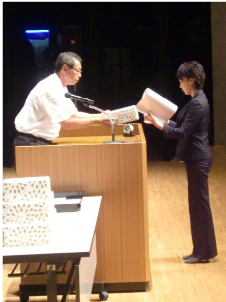
調理員永年勤続表彰