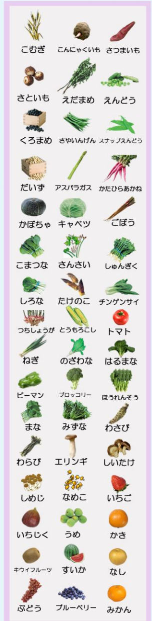
こむぎ こんやくいも さつまいも さといも えだまめ えんどう くろまめ さやいんげん スナップえんどう だいず アスパラガス かたひらあかね かぼちゃ キャベツ ごぼう こまつな さんさい しゅんぎく しろな たけのこ チンゲンサイ つらしょうが とうもろこし トマト ねぎ のぎわな はるまな ピーマン フロッコリー ほうれんそう まな みすな わさび わらび エリンギ しいたけ しめじ なめこ いちご いちじく うめ かき キウイフルーツ すいか なし ぶどう ブルーベリー みかん