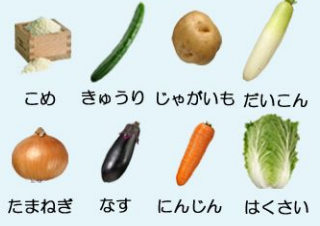
こめ きゅうり じゃがいも だいこん たまねぎ なす にんじん はくさい